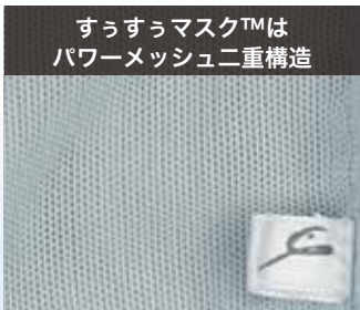
すっすっマスク™は パワーメッシュ二重構造

パワーメッシュの二重構造で、まるでマスクを着けていないような軽さ♪呼吸がしやすいから、もくもくとレッスンする方に最適！